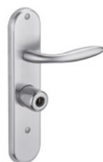
MANILLA Acabado cromado o latón pulido